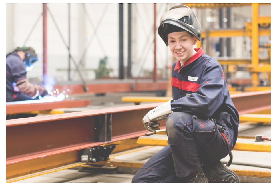
Die Gesichter unserer Mitarbeiter in der Personalmarketing-Kampagne