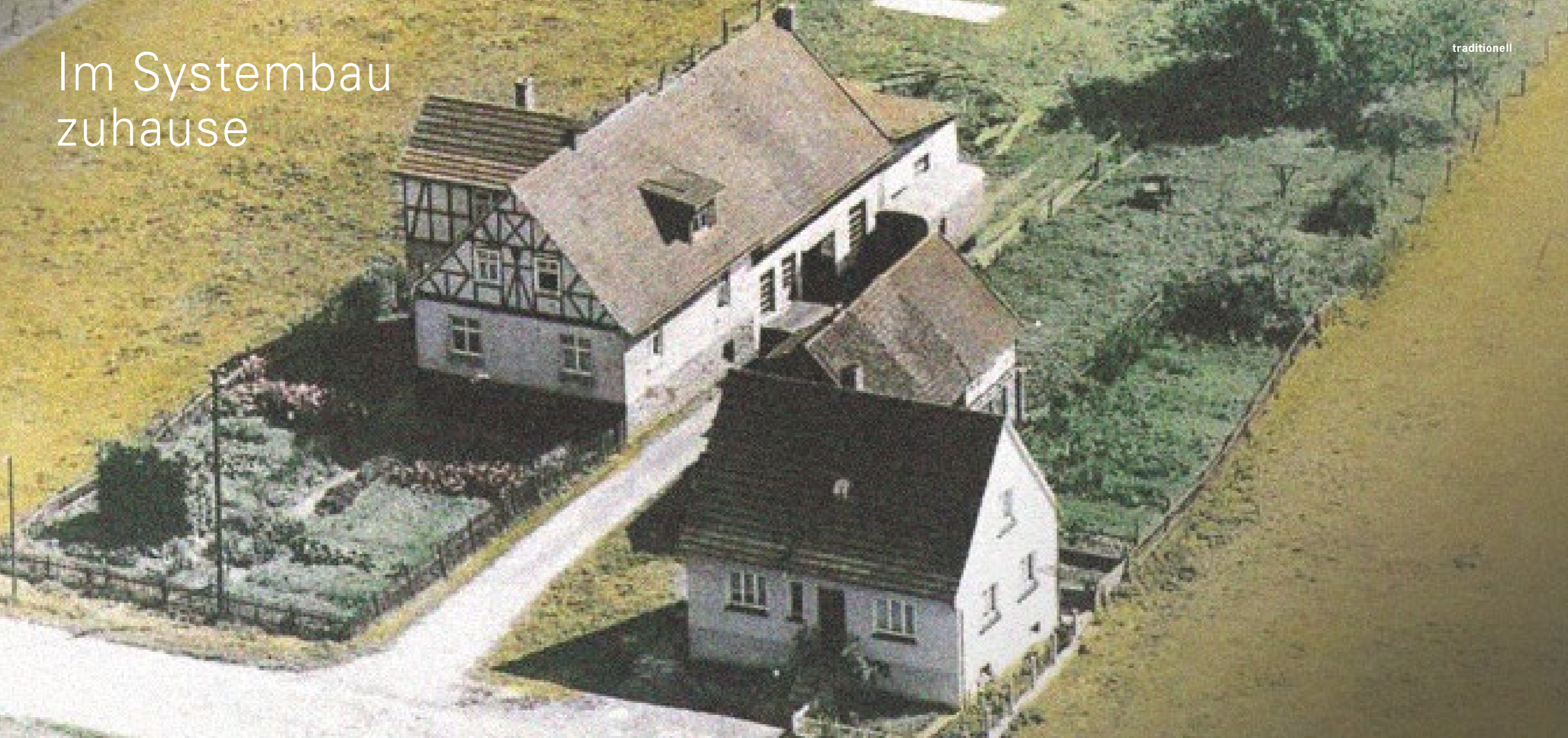
Das ALHO Firmengelände 1967: Stellmacher-Werkstatt auf Hof mit Einfamilien-Fachwerkhaus

Vom Hersteller von Bauwagen zum Spezialisten für Modulbau: Wir sind einer der Pioniere des seriellen Bauens. Was Politik, Interessensverbände in der Bauwirtschaft, Architekten und Bauherren als die Zukunft des Bauens propagieren, ist bei uns seit über 50 Jahren Realität.