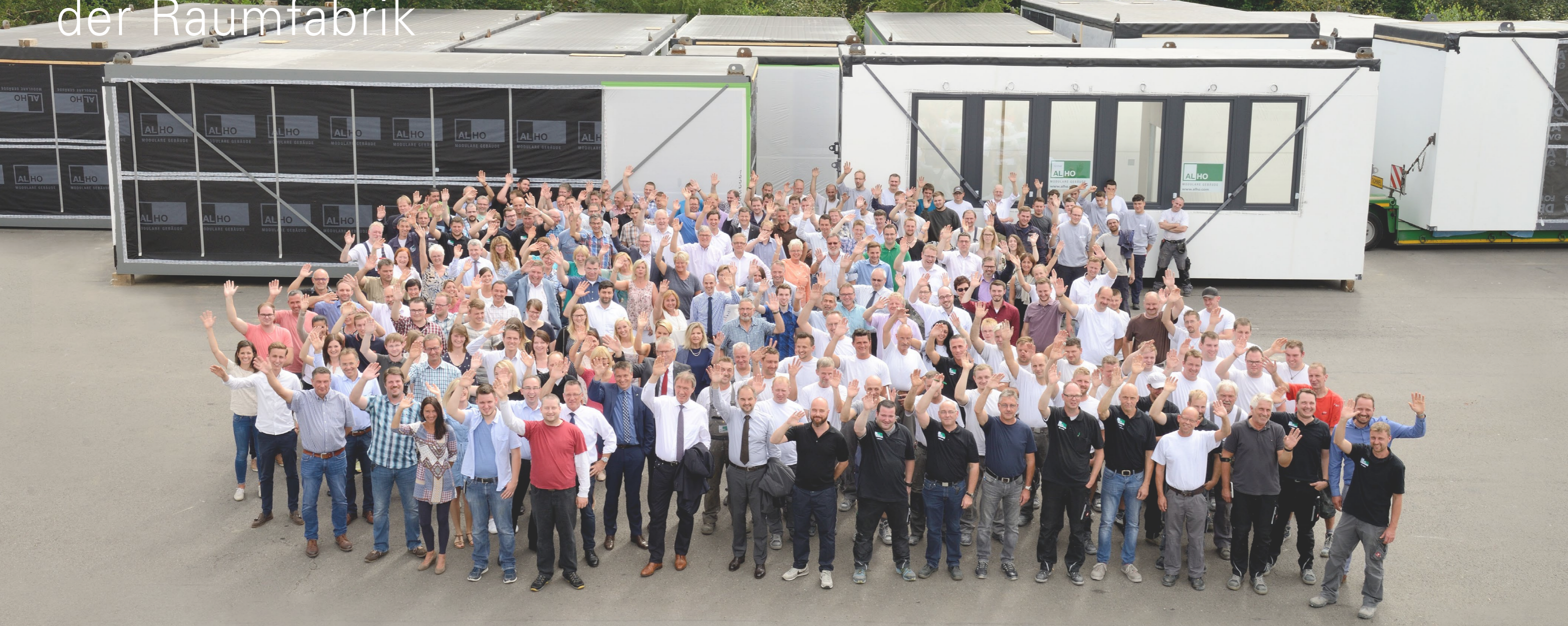
Die Mitarbeiterinnen und Mitarbeiter der Frühschicht und der Verwaltung am Standort Friesenhagen