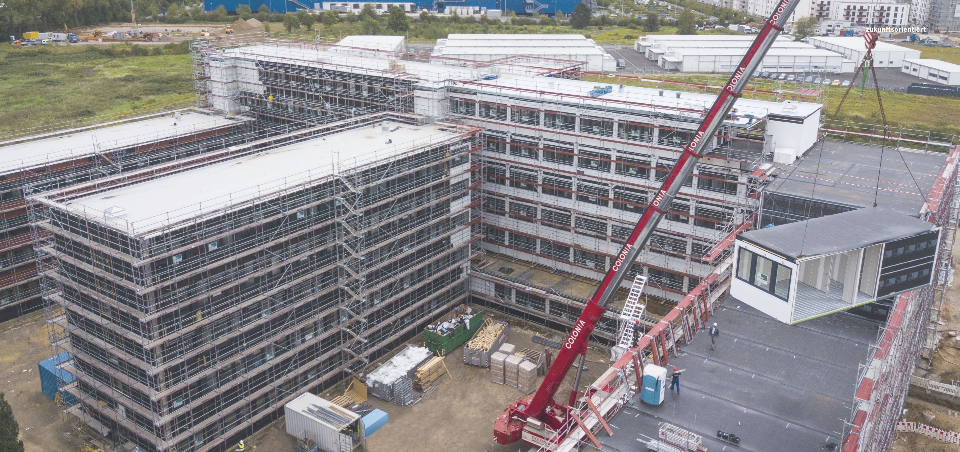
Die Modulmontage der Bundesagentur für Arbeit, Arbeitsagentur in Köln