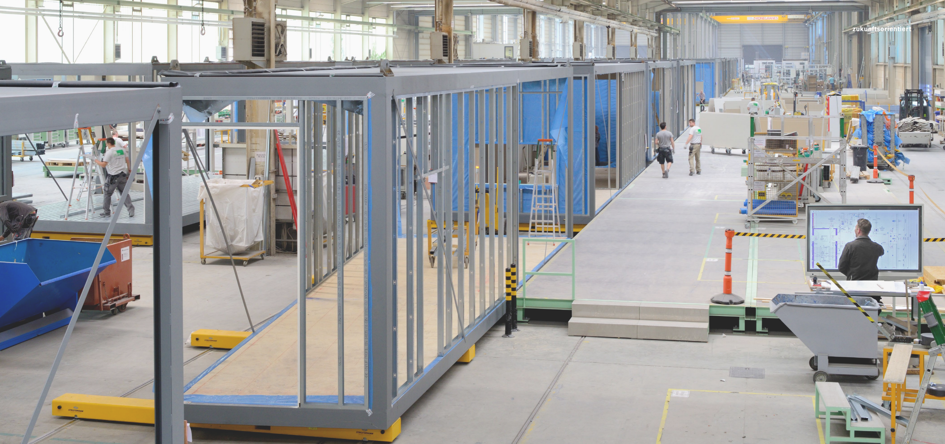
Die serielle Fertigung in der ALHO Raumfabrik