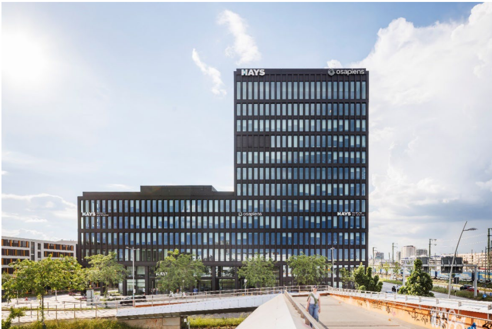
Die Büroimmobilie LOKSITE bietet rund 25.000m 2 flexibel nutzbare und modernst ausgestattete Bürofläche. Alle Büroeinheiten konnten von D&S bereits während der Realisierungsphase an renommierte Unternehmen vermietet werden.