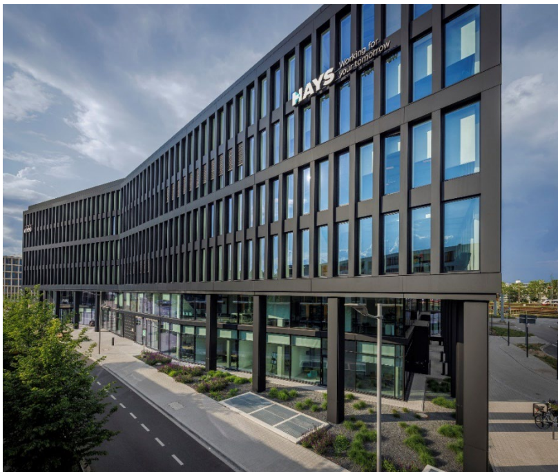
Der Gebäudekörper von LOKSITE ist von Dynamik und einer ikonischen Fassadengestaltung geprägt. Innen eröffnen sich den Nutzern flexible Arbeitswelten.