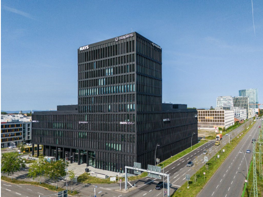
Die Büroimmobilie LOKSITE markiert das südliche Entrée des Wohn- und Business Districts Glückstein-Quartier in Mannheim